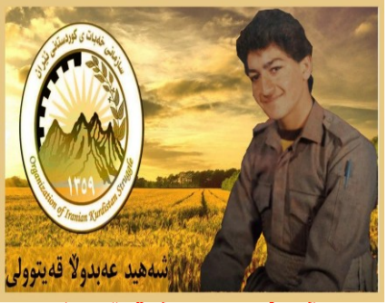
سه‌روه‌ری گهل شه‌هید عه‌بدولا قه‌یتولی ناسراو