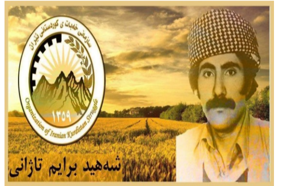
سهروه رى گه ل شه هيد برايم تازانى .