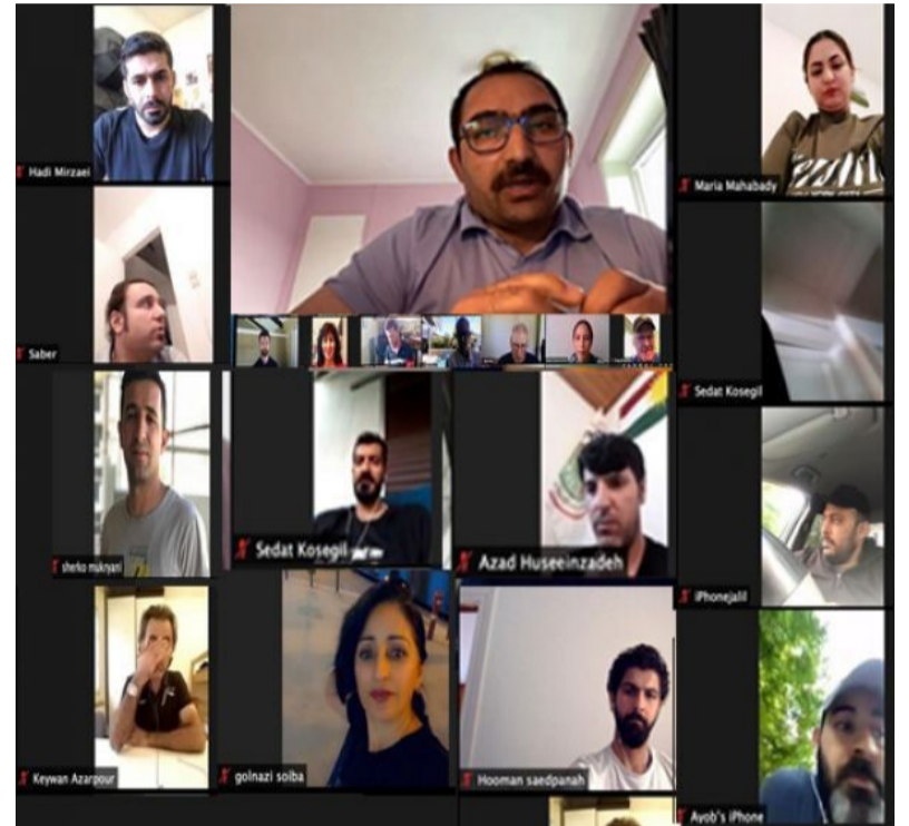
رۆژى شه ممه 24 جوزهدانى 1399 ی ههتاوى، له درێژى كۆبوونهوه تهشكیلاتیهكان ریکخستنى دهرهوى سازمانى خەباتى كوردستانى ئىران كۆبوونهوهیهكى ئینتهرنهتیه بۆ ژمارهیهك له ئەندامانى دیار و دتسۆزى سازمانى خەبات له وهلاتانى : سوویس، ئوتریش، ئینگلیس، سپانیا، بلژیک،